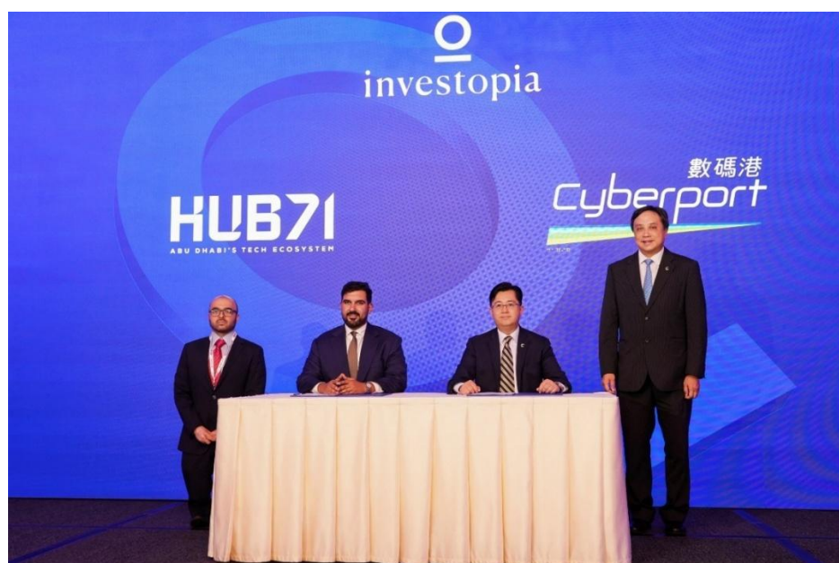
▲ 數碼港與阿聯酋知名科技孵化器 Hub71 簽署合作備忘錄，正式建立戰略夥伴關係，透過跨境合作連結創新樞紐。

數碼港積極實踐「一帶一路」倡議，近年多次率初創企業出訪中東、東盟等地區，將本港及內地的創科成果引入高潛力市場，以中國香港的創新實力，推動跨地域的數字經濟。數碼港持續深化「一帶一路」的戰略夥伴關係。在近年與沙特阿拉伯國家級科技城（KACST）、迪拜未來基金會（Dubai Future Foundation）等已達成的合作基礎上，數碼港於2025年再與阿聯酋科技孵化器 Hub71 建立戰略夥伴關係，透過「Hub71 初創體驗計劃」促進雙方生態圈互聯互通，協助香港及內地初創企業以阿布扎比為基地拓展區域業務，同時吸引具潛力的中東企業以香港作為門戶，進軍內地及東南亞市場。