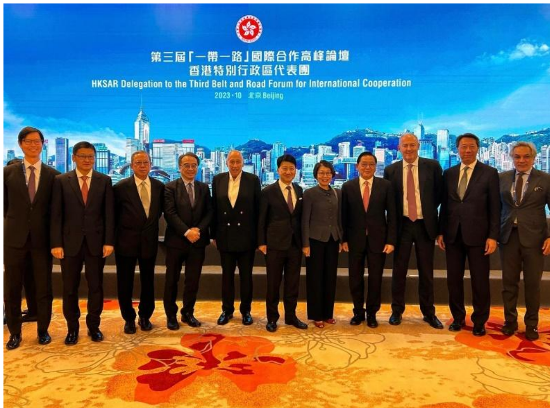
▲ 行政長官率領的香港特別行政區代表團出席在北京舉行的「一帶一路」國際合作高峰論壇。