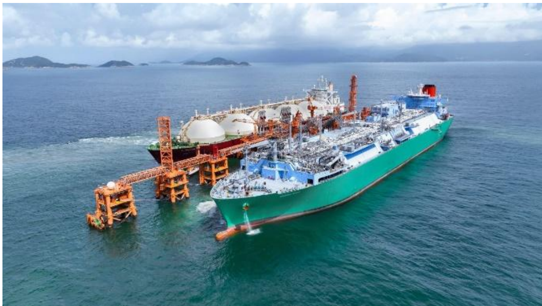
▲ 於 2023 年落成啟用的香港海上液化天然氣接收站。