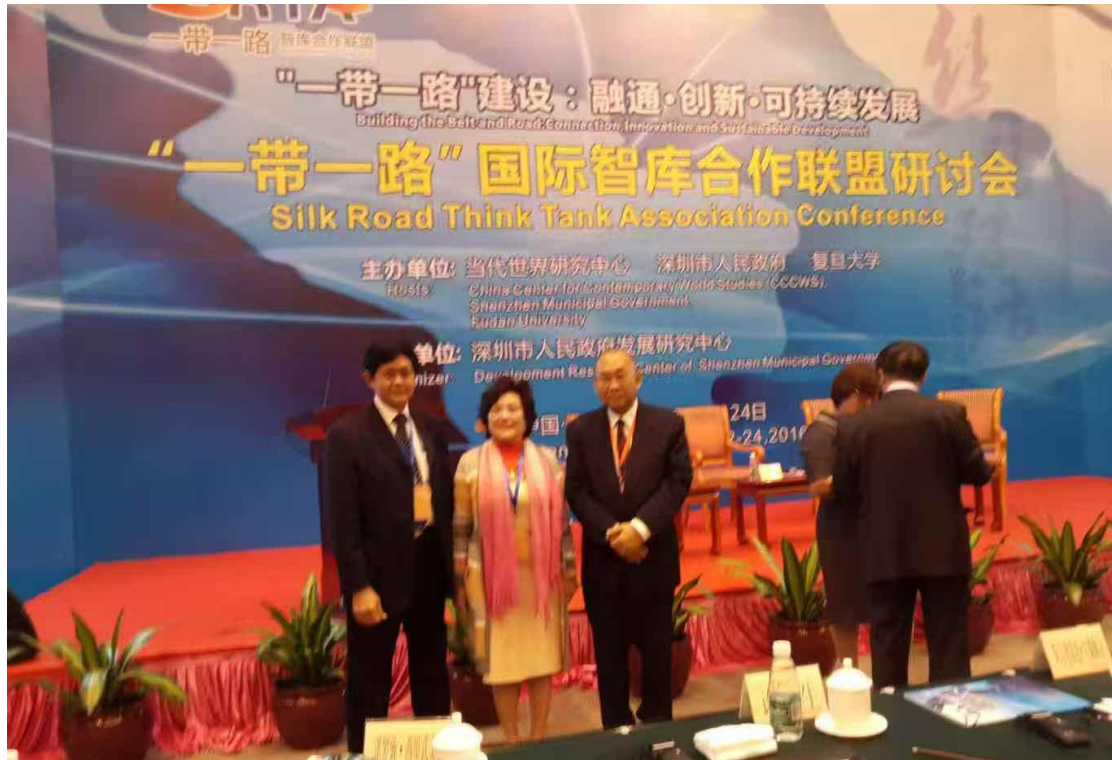
▲ 詹瑪麗出席一帶一路國際智庫合作聯盟研討會。

在共商共建共用的原則下，東帝汶與中國的合作結出了累累碩果。中國企業參與建設的基礎設施，正深刻改變著國家的面貌：穩定運行的電網為千家萬戶送去光明，新建的高速公路縮短了時空距離，現代化的貨櫃碼頭提升了物流效率。這些都是「一帶一路」合作的縮影，它們夯實了東帝汶發展的根基，也為更多領域的投資創造了條件。