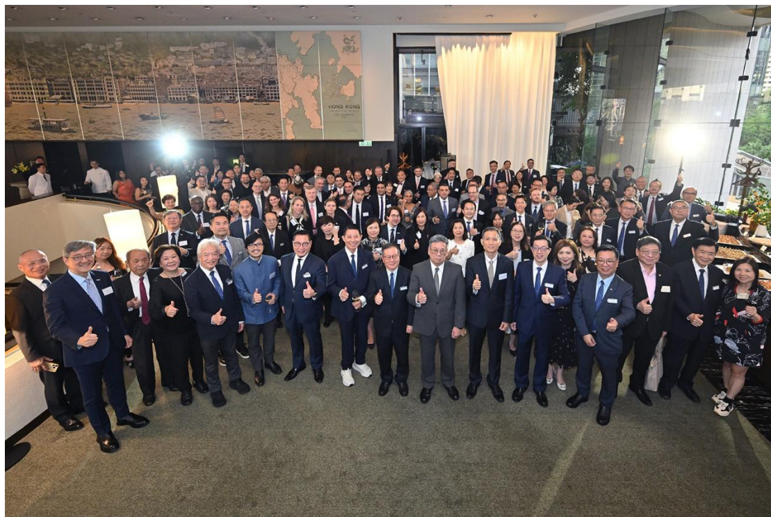
▲ 年度「廠商會與各國駐港領事交流酒會」。

Connecting the World from Hong Kong: 100 Belt and Road Stories