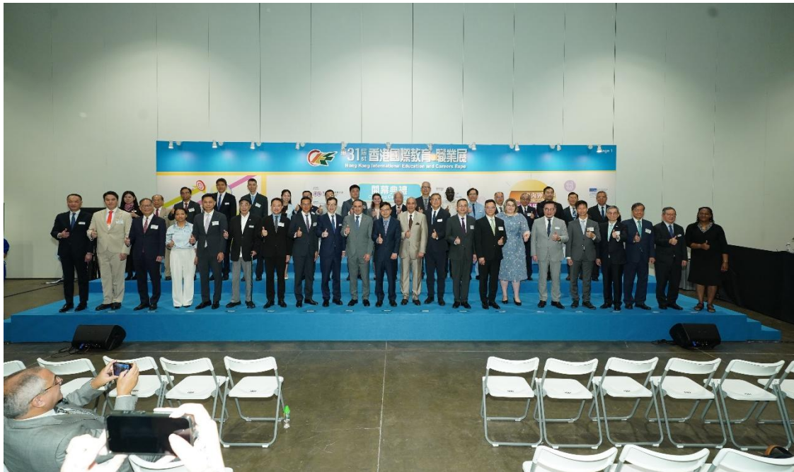
▲ 「一帶一路」國家駐港領事機構代表出席「第31屆香港國際教育及職業展」。

Connecting the World from Hong Kong: 100 Belt and Road Stories