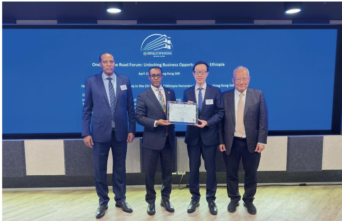
▲ 廠商會與埃塞俄比亞當局合辦「一帶一路商務論壇 - 解鎖埃塞俄比亞無限商機」。

廠商會深明，「一帶一路」不僅是一條經貿合作之路，更是一條文明互鑑、民心相通之路。因此，我們曾贊助香港特區政府設立的「一帶一路」獎學金，支持來自馬來西亞、印尼的青年學子來港攻讀學士課程。此外，由廠商會主辦的「香港國際教育及職業展」，近年亦邀請了一些「一帶一路」國家駐港領事機構參展，向青年人介紹當地的升學資訊。我們相信，這些舉措不僅提升了香港高等教育國際化與多元化水平，更有助於促進香港與「帶路」國家青年之間的交流與理解，為長遠友誼和合作播下種子。