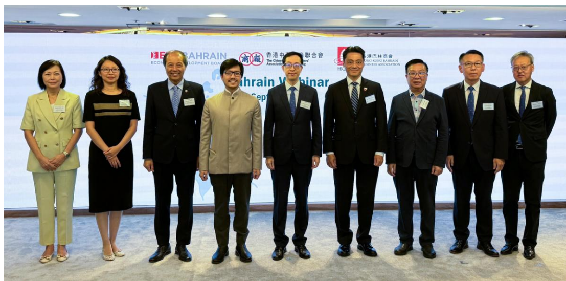
▲ 廠商會聯同巴林經濟發展委員會和香港巴林商會合辦研討會。