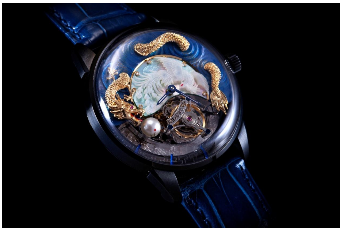
▲ 創立民族鐘錶品牌「萬希泉」，打造兼具文化內涵與國際審美的產品，把國家文化軟實力轉化為市場價值。

「萬希泉」由此誕生——我們以香港為研發與營運樞紐，連接內地工藝資源與國際市場，將中華文化元素與現代製表技術融合，打造兼具文化內涵與國際審美的產品。香港在當中發揮了關鍵作用：完善的知識產權制度、成熟的專業服務、國際化的市場網絡，讓品牌得以穩步「走出去」。