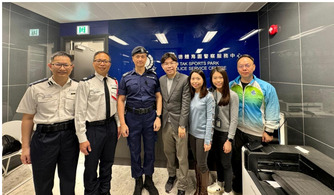
▲ 香港千帆科技與香港警務處合作，共同開發了利用 AI 疏導人流的「離場易」平台。

未來，我們亦期望把這些成熟的 AI 應用經驗，延伸至「一帶一路」沿線市場，推動數字合作，讓香港的科技能力成為國際公共服務與產業升級的助力。