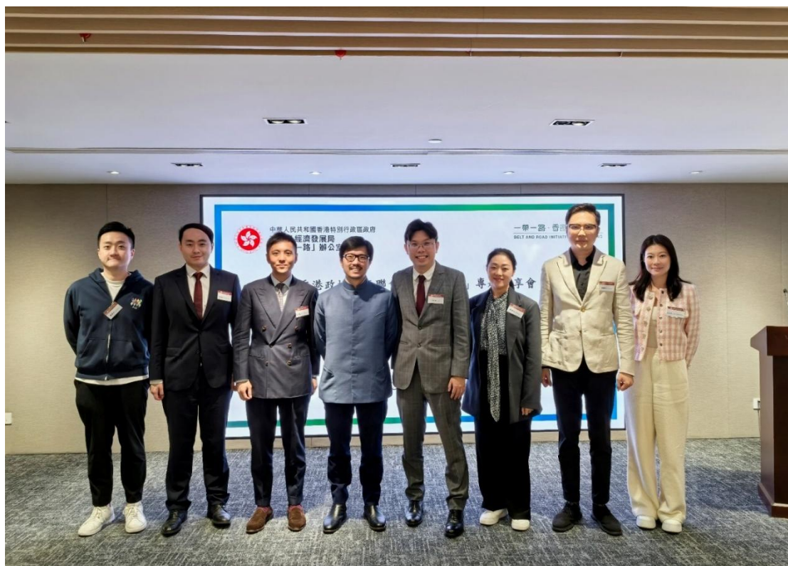
▲ 作為香港政協青年聯會主席，邀請商務及經濟發展局「一帶一路」專員何力治作「一帶一路」專題分享會。

企業的成長，離不開時代與制度的支撐。多年來，我透過不同社會及商界平台，積極推動香港與內地在「一帶一路」框架下的交流合作，分享香港企業「走出去」的實戰經驗，促進資源對接。