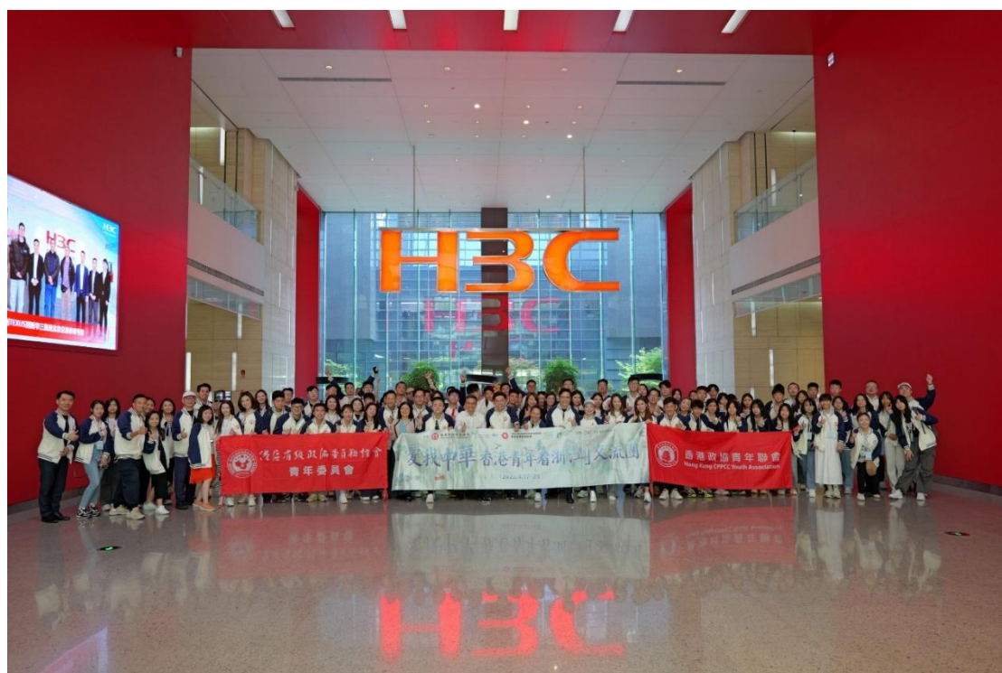
▲ 組織「愛我中華香港青年看浙江」交流團，參觀新華三集團。

同時，我亦長期投入青年工作，深信「一帶一路」的可持續發展，離不開新一代的參與。透過組織交流團、企業考察與分享活動，我希望協助香港青年更立體地理解國家發展方向，找到自身專業與國家戰略的結合點，讓先行者的經驗成為後來者的指引。