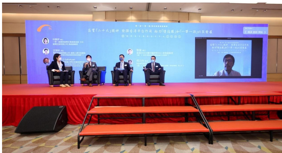
▲ 任第一屆「一帶一路」青年發展高峰論壇演講嘉賓，分享香港企業「走出去」的實戰經驗。

作為這段歷程的見證者與參與者，我的創業與實踐之路，正是香港參與「一帶一路」建設的一個縮影——從文化品牌出海，到人工智能創科落地，從匠心傳承到科技賦能，我深切體會到香港如何把制度優勢、專業能力與國家發展方向結合，轉化為具體而長遠的成果。