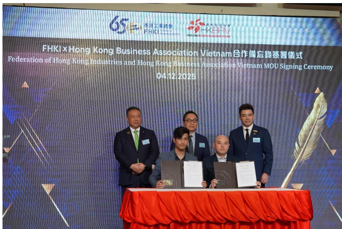
▲ 工總過去兩年與 12 個「一帶一路」國家相關的機構或商會簽署合作備忘錄。

Connecting the World from Hong Kong: 100 Belt and Road Stories