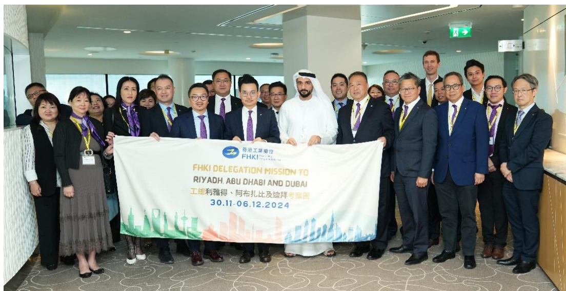
▲ 工總 2024 年 12 月率團訪問中東，協助會員開拓當地人脈與機遇。