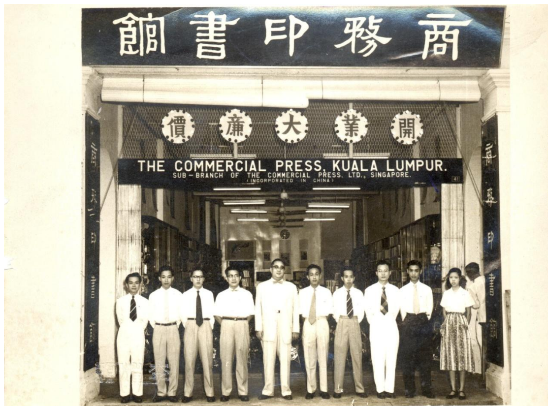
▲ 馬來西亞商務印書館（馬館）開業。

馬館自1956年9月25日啟運至今，已近70年。馬館一度在雪隆、北馬、東馬等地開分店，後接連撤除，剩蘇丹街一家總店。