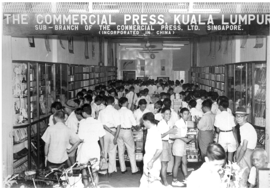
▲ 馬館書店人潮絡繹不絕，讀者趁著閒暇時光穿梭於書櫃之間，沉浸於書香世界。

其中，深具人文氣息的讀書會「衣魚說書」已堅持逾十年；「親子共讀繪」陪伴一代又一代家庭共讀成長；近年還有「每月微型展」、「深度導讀」、「邊上漫談」等，讓吉隆坡市中心多了一處匯聚華文知識、思想和文化的重要交流空間。