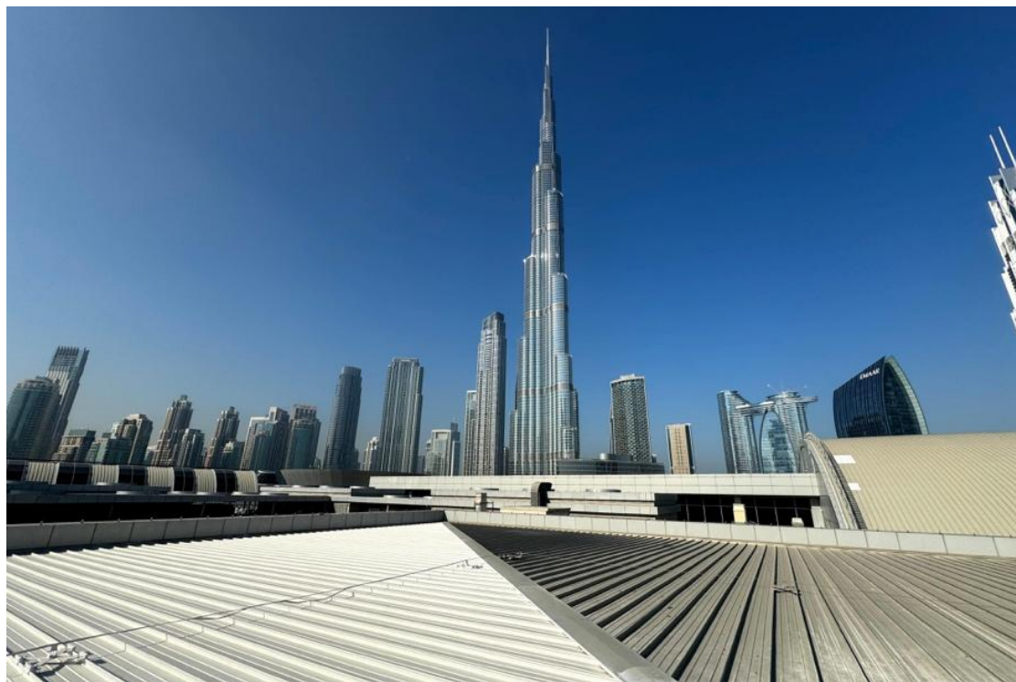
▲ 中東項目：迪拜購物中心

在這一過程中，香港的平台優勢發揮了關鍵作用。完善的知識產權制度為技術出海提供保障；國際化專業服務網絡提升跨境合作效率；多元文化環境有助於理解不同市場需求。香港不僅是資金與資訊的橋樑，更是把科研成果轉化為國際解決方案的增值平台。