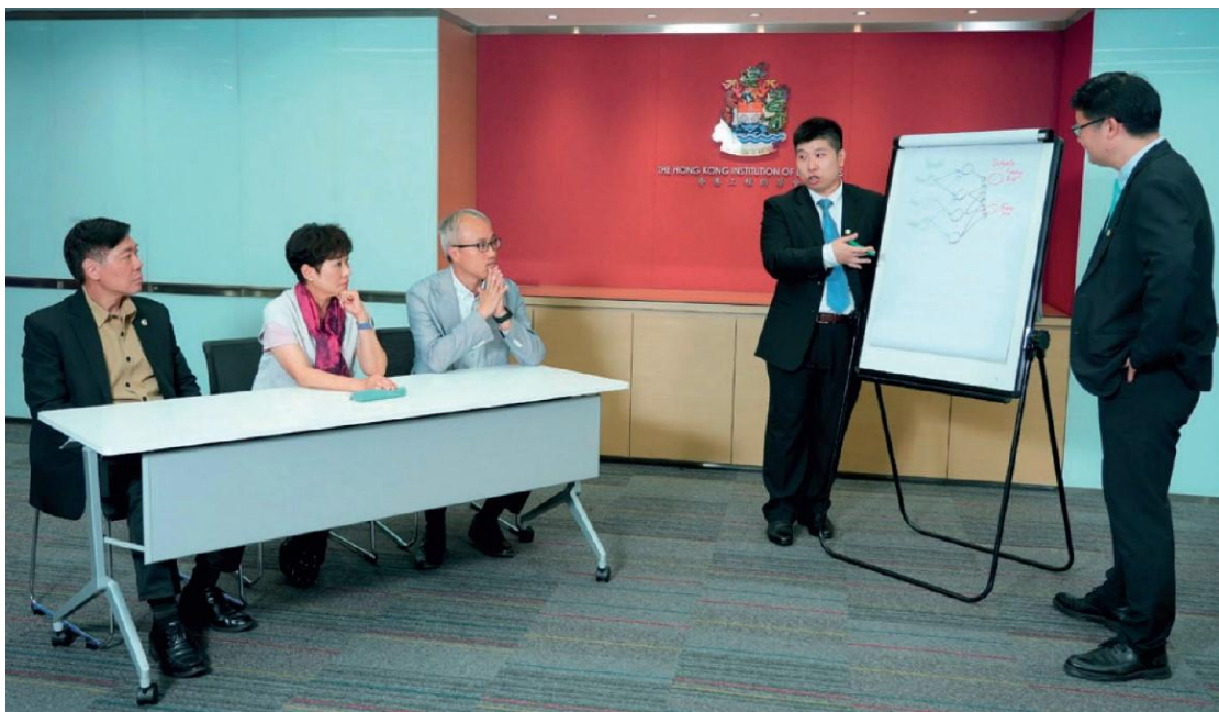
▲ HKIE Enginpreneurs: 學會設立「工程企業家計劃 Enginpreneurs」，冀支持工程創科落地。

僅要考慮技術可行性，亦要考慮成本、市場定位、推廣等商業元素，這亦促使我以「同心同創 Together We RISE」為學會年度主題，以韌性 (Resilience)、創新 (Innovation)、可持續 (Sustainability)、公平 (Equity) 四大核心價值凝聚業界力量，並透過設立「工程企業家計劃 Enginpreneurs」，支持工程創科落地，以及組織業界活動，增強業界人士的技能、促進知識交流，並支持業界使用新興技術，促進創新及發展。