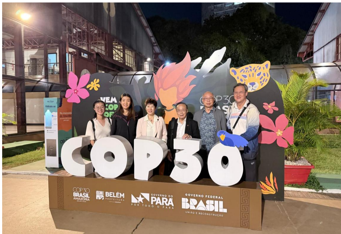
▲ COP30: 學會出席 COP30，分享香港在能源轉型、低碳城市發展及氣候韌性基建方面的工程實踐。

香港人擅於捕捉不同商機，而香港擁有「超級聯繫人」及「超級增值人」的優勢，這群早早來到中東的工程師和創科公司，因應中東地區銳意擺脫對石油的依賴，以各種綠色科技應付當地炎熱天氣帶來的挑戰，這些產品或服務正正展示香港作為「超級增值人」，將國家戰略轉化為惠及民生的寶貴全球實踐：其中一項塗料，可有效地降低建築物的表面溫度和室內溫度，有助減少建築物空調系統的能源消耗，這不僅可以應用於炎熱的中東地區，亦有助全球不同地區的建築物實現節能減排。