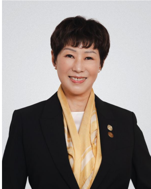
香港工程師學會會長 周健德

Connecting the World from Hong Kong: 100 Belt and Road Stories