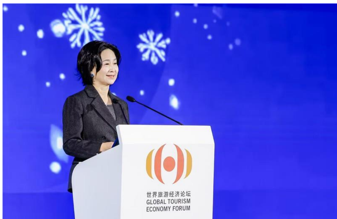
▲ 世界旅遊經濟論壇 搭建國際高端對話平台。

Connecting the World from Hong Kong: 100 Belt and Road Stories