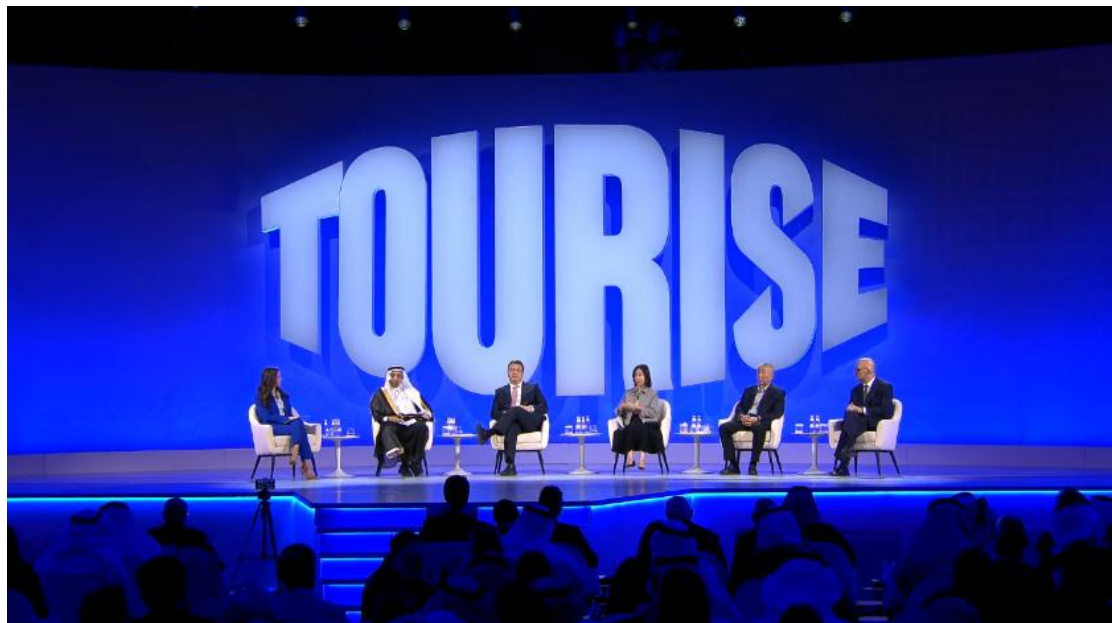
▲出席首屆 TOURISE 峰會，分享全球經濟新格局下的文旅發展展望。

「面向未來，香港大可進一步發揮其技術底蘊與文化軟實力，擔當起『一帶一路文化 IP 孵化基地』的重任。這意味著香港需積極推動國際合作，在絲路沿線深入挖掘更多可共享的數碼『原材料』，並將這些珍貴的古蹟數字檔案，轉化為向下游創意設計與商業開發輸送的養分。此舉旨在打通一條從『數據資產』延伸至『消費產品』的完整鏈條，讓沉睡的歷史『文化存量』，真正蛻變為活躍的『經濟增量』。」