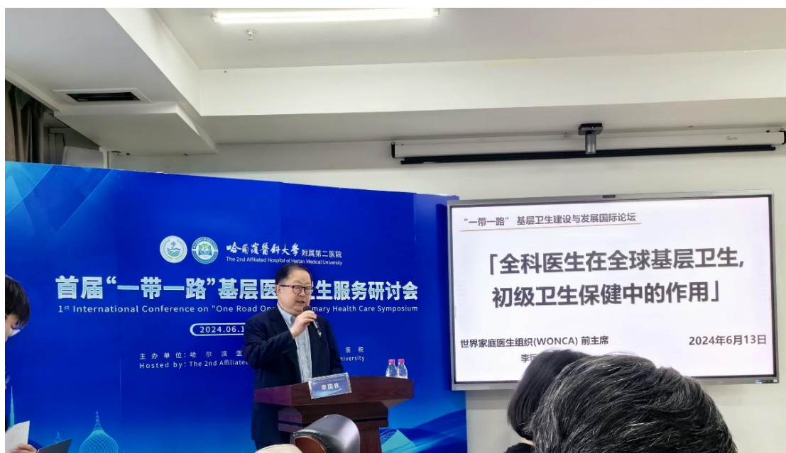
▲ 2024年6月13日至14日出席首屆「一帶一路」基層醫療衛生服務研討會。

醫學發展。憑藉多年努力工作獲得的肯定；以及利用國際組織（WONCA）的影響力；個人在相關的論壇、研討會，與「一帶一路」沿線國家與會者交流討論全科醫學人才培養，基層醫療衛生高質量發展等議題，藉此提升香港作為基層醫療領域領航者的地位；吸引更多互聯互通的合作機會，促進相關醫療服務的輸出或引進，實現國家健康發展戰略。