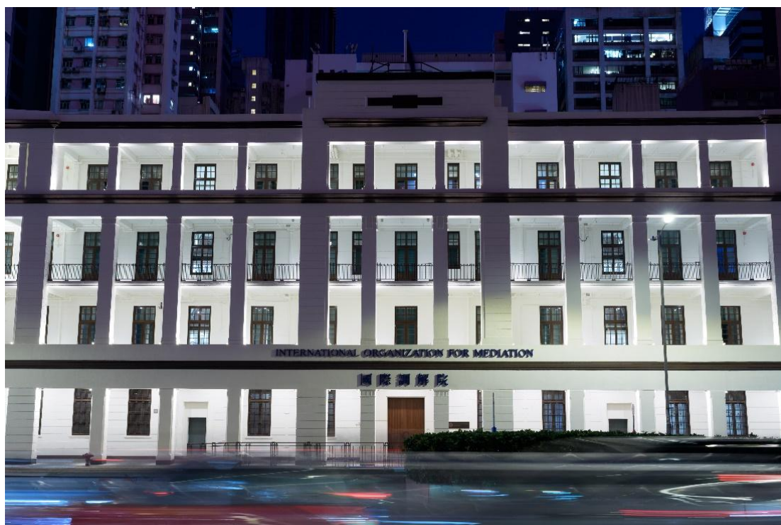
▲ 位處香港鬧市區霓虹燈下的國際調解院總部

Connecting the World from Hong Kong: 100 Belt and Road Stories