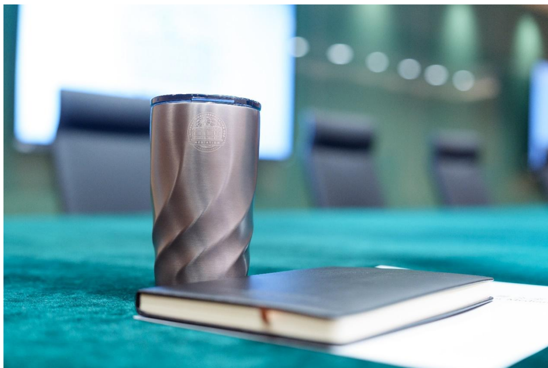
▲ 體現出剛柔並濟理念的國際調解院紀念杯